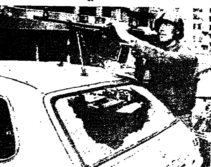
جندى سوري يركز رشاشه على سلع سيارة أصيبت في الاشتباكات الأخيرة

قلت مصادر حزب الله، أمس أن الحزب اكتشف أمس السبت محاولة لاغتيال العلامة محمد حسين فضل الله. وقال المتحدث باسم الحزب أنه تم اكتشاف سيارة تحمل ٨٠ كيلوغراماً من الإلغام والمتفجرات في طريق قبل أن يمر فيه السيد فضل الله وهو في طريقه إلى مسجد بير العبد في الضاحية الجنوبية لبيروت. وأضاف المتحدث قوله أن السيارة الملغومة كانت تستهدف حياة الشيخ فضل الله، ومضى يقول أن السيارة كانت رابضة على الطريق الذي اعتد السيد فضل الله أن يسلكه كل يوم في ساعة معينة في طريقه لاداء الصلاة بالمسجد. وقال المتحدث باسم حزب الله أن وحدات الأمن الخاصة بالجماعة عثرت على السيارة الملغومة وأبطلت مفعولها، وأنها القت القبض على عدد من الأشخاص لاستجوابهم. من ناحية أخرى، ساد هدوء حذر إحياء ومناطق بيروت الغربية التي كانت مسرحاً للاشتباكات بين مسلحي حركة أمل، وحزب الله، وادت إلى سقوط حوالي ثلاثة عشر قتيلاً وخمسة وعشرين جريحاً وأحدثت أضراراً جسيمة بالممتلكات والسيارات. هذا، وتوسع القوت العربية السورية دوريات كما تقم حواجز ثابتة في المناطق التي كانت مسرحاً للاشتباكات. وكانت القوى السورية عملت منذ ظهر أمس الأول على سحب المسلحين من الجسور الخندق الضيق، محطة الضناوي - برج أبي حيدر - جسر سليم سلام - محيط المستشارية الإيرانية - البلاط، جنباً إلى احتكاك بعيد التوتر إلى ما كان عليه.